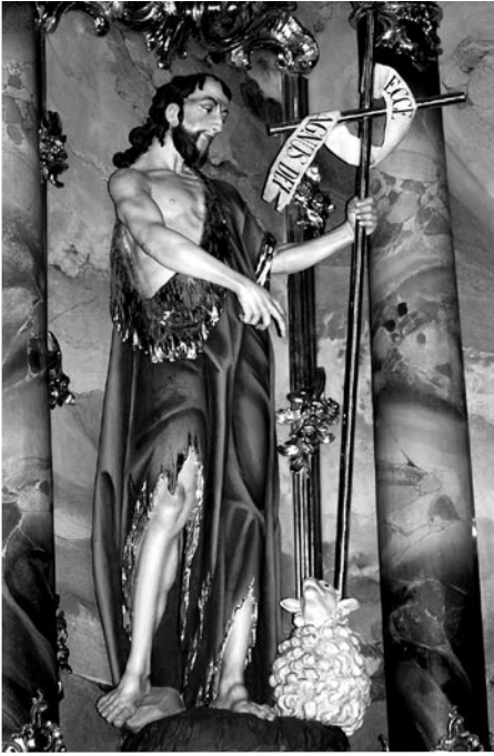
Hl. Johannes der Täufer: linke Figur des barocken Hochaltars der Stefanskirche aus dem Jahre 1767 – aufgestellt zur Erinnerung an die Johanneskirche.

Oberacherns auf den bisherigen Lichtzehnt in Vergangenheit und Zukunft abgegolten waren.